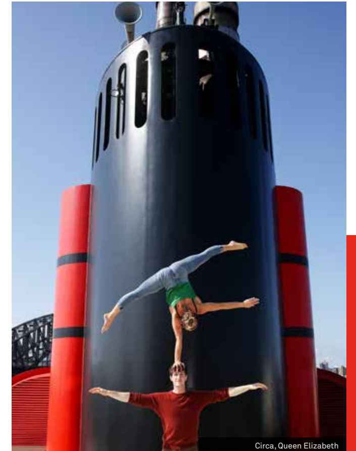
Circa, Queen Elizabeth

Los actores de la Royal Shakespeare Company pasan temporadas a bordo del Queen Mary 2 encantando a los huéspedes con sus producciones escénicas y sus conocimientos entre bastidores. Los talleres son una delicia; puede que descubra su talento para escribir obras de teatro. Y por las noches, conozca a los actores en Shakespeare Tales, sus representaciones íntimas e informales de sus obras favoritas.