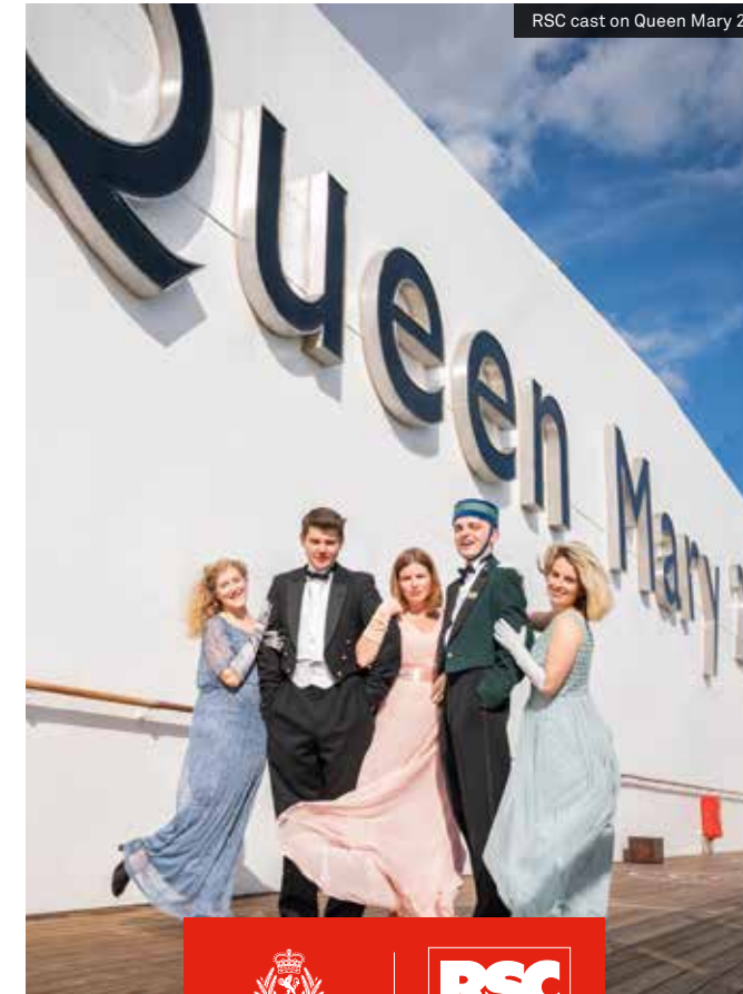
RSC cast on Queen Mary 2