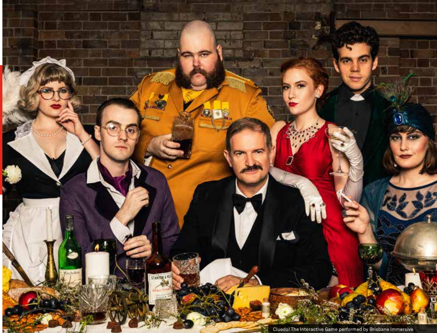
Cluedo! The Interactive Game performed by Brisbane Immersive

Es una visita obligada para los amantes del teatro, con un calendario de producciones en constante crecimiento que está marcando la pauta del entretenimiento en el mar. Imagínesse acróbatas que le dejarán boquiabierto, o El mejor hotel exótico Marigold, incluso una experiencia gastronómica inmersiva de asesinato misterioso. Esta es una nueva era para el teatro de Cunard y su futuro es apasionante.